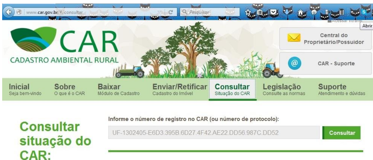
Figura 02. Página de acesso do SICAR. É necessário o número do protocolo para acesso ao CAR. Disponível em http://www.car.gov.br/#/consultar

No entanto, não é isso que se percebe quando do acesso ao SICAR através do seu portal na internet . O sítio possui uma área em que é denominada de “CONSULTAR – situação do CAR” e quando se adentra nesta, o próximo passo é inserir o número do registro do CAR ou o número de protocolo para que o mesmo seja aberto, e ainda, dispõe na mesma página a legenda em que descreve três situações possíveis para o CAR: ativo, em que consta que o mesmo foi analisado e está correto, tendo em vista a análise já realizada dos dados e esta constatar a regularização da área; pendente, em que significa que o CAR possui informações incorretas ou com áreas de sobreposição com Terras Indígenas, Unidades de Conservação, Terras da União, áreas impeditivas, embargadas, ou com outros imóveis rurais e possuir outras obrigações ainda para realizar cumprimento; e Cancelado, quando as informações do CAR forem consideradas como falsas, no total ou parcialmente, enganosas ou omissas (figura 02).