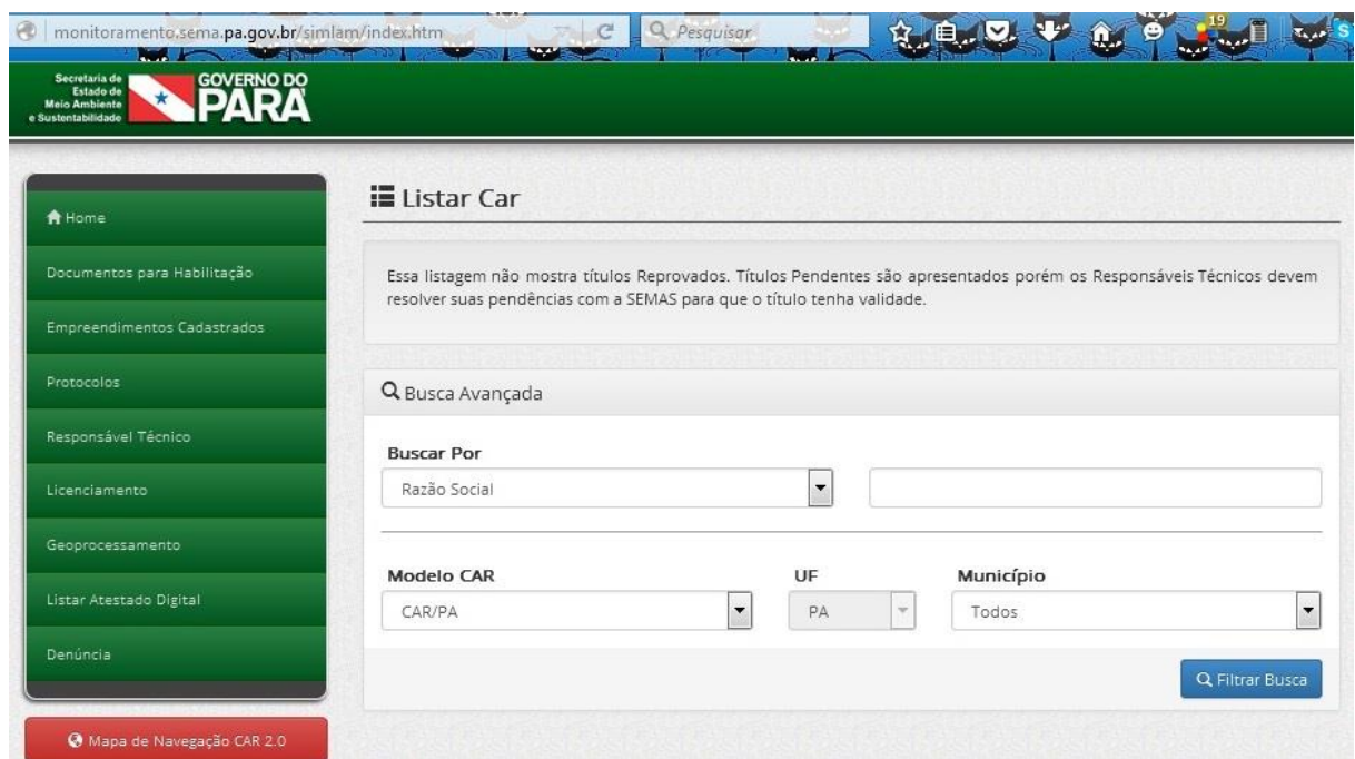
Figura 05. Tela de consulta do CAR/PA através do SIMLAM.

A outra versão é SIMLAM Público, em que se trata de uma plataforma em que se disponibiliza para a coletividade e a quem se interessar, o acompanhamento dos processos e das atividades que obtiveram licenças pela SEMAS. Essa versão do SIMLAM veio justamente para promover a transparências das informações tendo em vista a importância da transmissão e do acesso a informação a população em geral, e não somente aos proprietários e os posseiros em suas respectivas áreas.