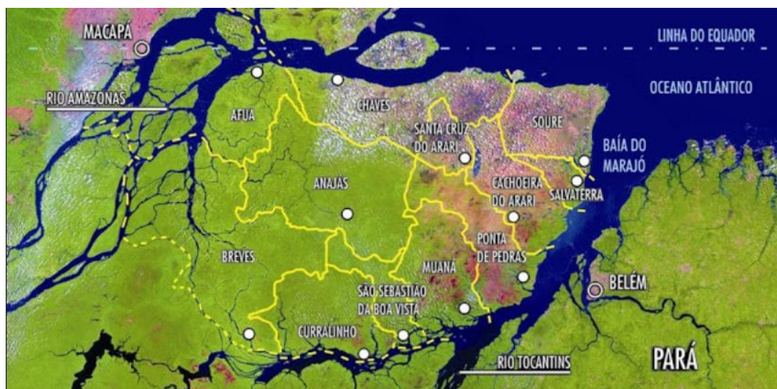
Figura 01 – Mapa do arquipélago do Marajó

O arquipélago do Marajó é composto por diversos municípios nos quais as belas paisagens de igarapés, campos naturais, rios, mares, fauna e flora, contrastam com a pobreza e os baixos resultados do Índice de Desenvolvimento da Educação Básica (IDEB) e do Índice de Desenvolvimento Humano (IDH). Nele também ocorrem muitos casos de violação dos direitos de crianças e adolescentes, com vários casos de abuso e exploração sexual sido sistematicamente denunciados nacionalmente por lideranças populares e religiosas (CORSINI, 2013).