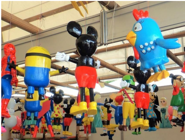
Figura 6 - Brinquedos de miriti com representação inovadora