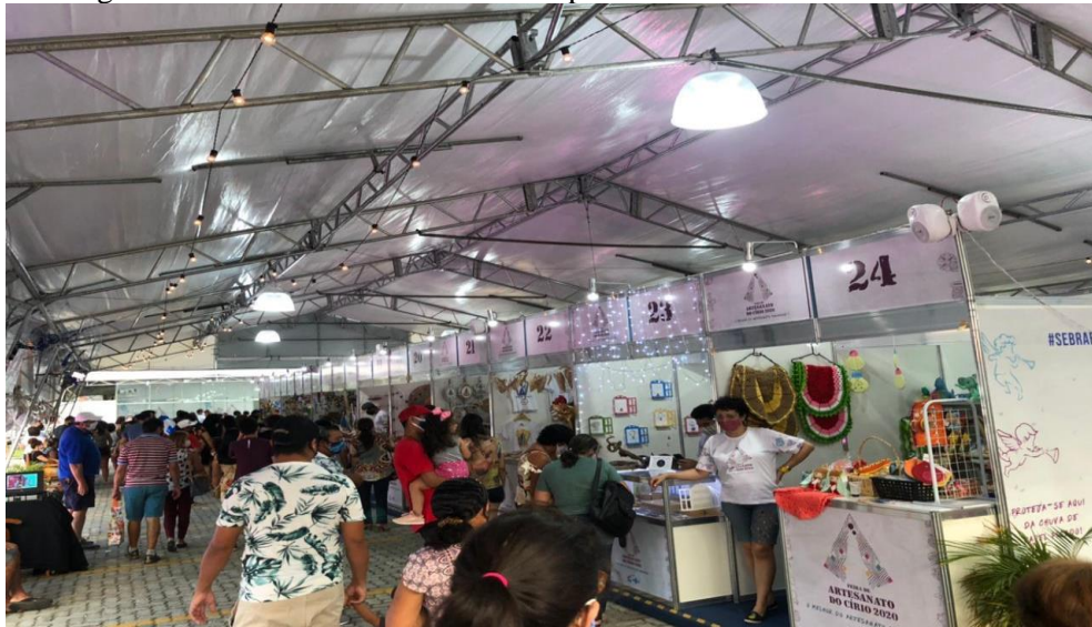
Figura 8 - Feira do Artesanato no complexo turístico Porto Futuro.