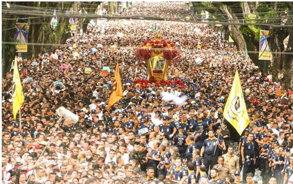
Figura 4 - Círio de Nazaré de 2019.