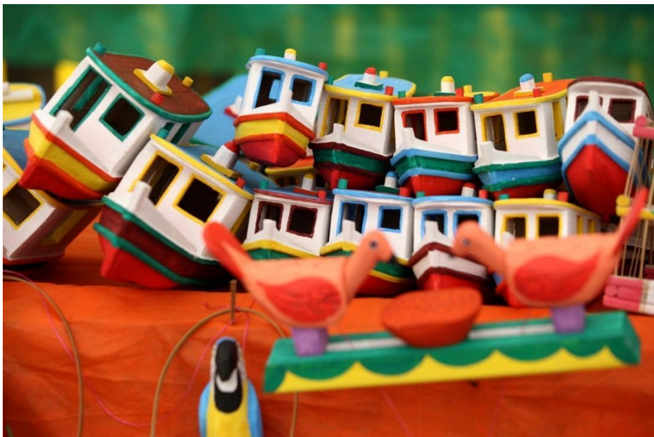
Figura 5 - Brinquedos de miriti com representação tradicional.