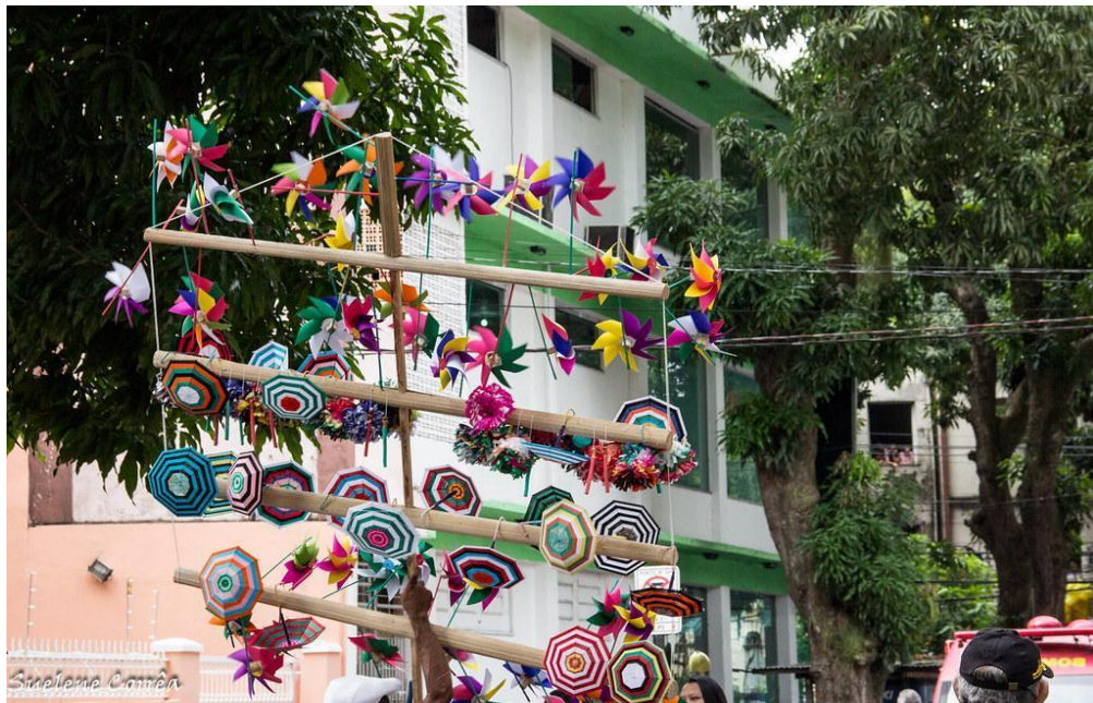
Figura 7 - Girândola feita de miriti.

Os girandeiros, como são conhecidos os vendedores que portam as girândolas carregadas de brinquedos de miriti, passaram a integrar a paisagem das procissões, sendo avistados em meio aos romeiros do seu percurso principal ou em ruas transversais, realizando uma intensa peregrinação por toda a cidade. Cabe destacar que, no Círio das Crianças, uma das 13 procissões da quadra nazarena, a presença dos girandeiros aumenta, devido ao maior número de crianças presentes, público alvo de comercialização.