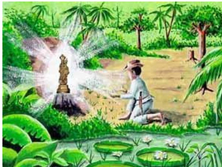
Figura 3 - Ilustração do achado da imagem por Plácido