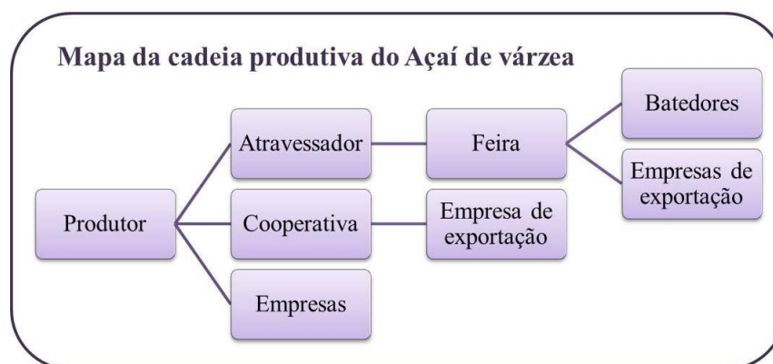
Figura 3: Cadeia produtiva do açai de várzea.